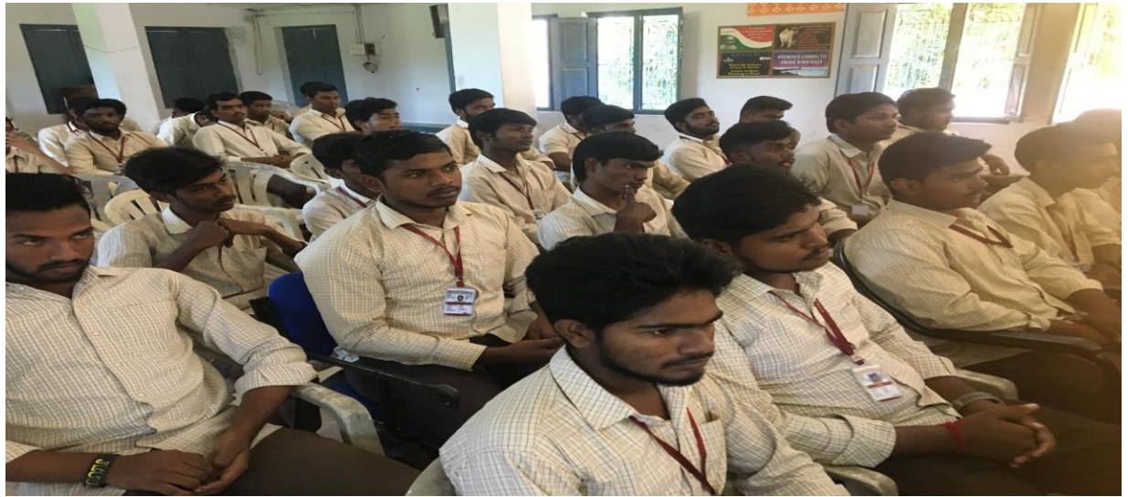
National Democracy Day