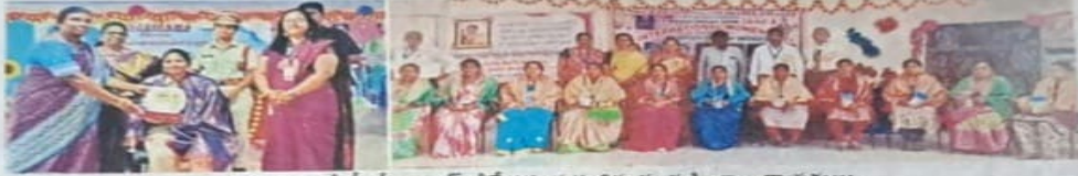
ఉషారామాల్ డీఎస్సీ డాక్టర్ శ్రీవేదమ సత్యరిస్తున్న మహిళా అధ్యక్షులు, ఉయ్యూరులో మహిళలను సత్యరిస్తున్న మాకల సాంఘికవరపు, ఏకే అండ్ ఎన్కేఎస్ కళాశాల ఉద్యోగులు